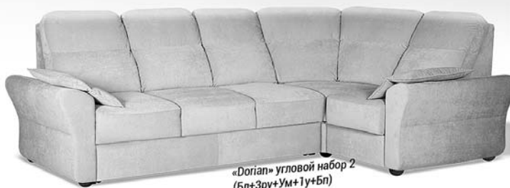
«Dorian» угловой набор 2 (Бл+Зру+Ум+Ту+Бп)